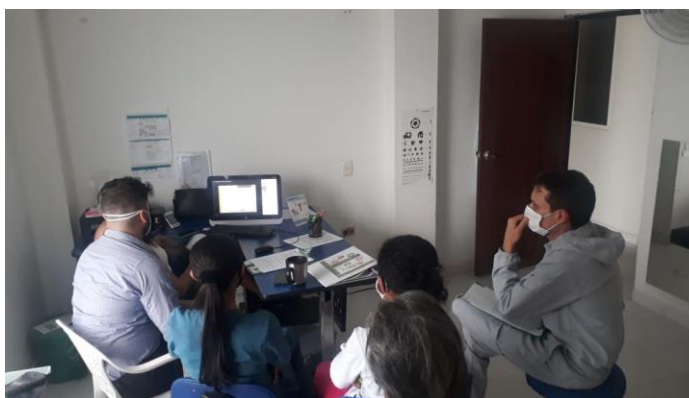
Evidencia de proceso de inducción.